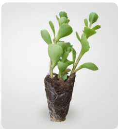
■ Sadzonka rozchodnika o średnicy bryły korzeniowej ok. 2,5 cm